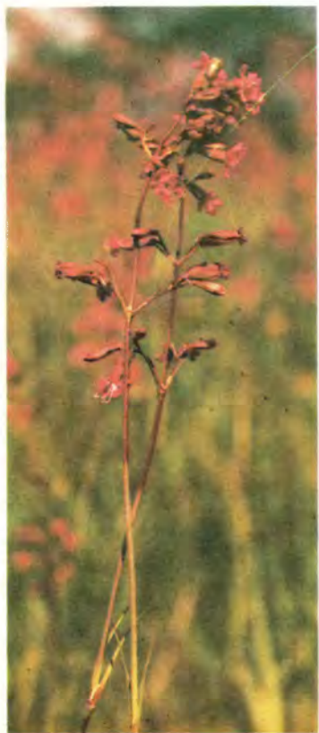
1103. Віскарія звичайна.